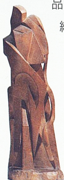
《久別》，24 × 28 × 73 cm，1966，木。

進一步分析這兩件省展得獎作品，均是朱銘從傳統木雕純寫實的創作型態轉向抽象寫意姿態表現的實驗型作品。《相悅》是由黃杞木雕刻而成，主題是一對環抱的男女，以簡約的S型曲線傳達出兩人軀體的美感，朱銘說：「以舒暢之線條雕出男女兩情相悅之動感，故取名為相悅。」令人驚豔的是，這件作品實為活動式組合，男女兩件可以分離或組合，再度顯現朱銘的巧思與創意。而